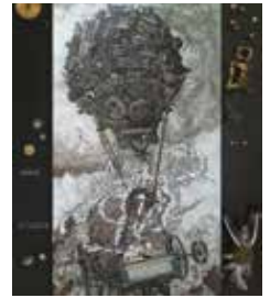
Dérouleur