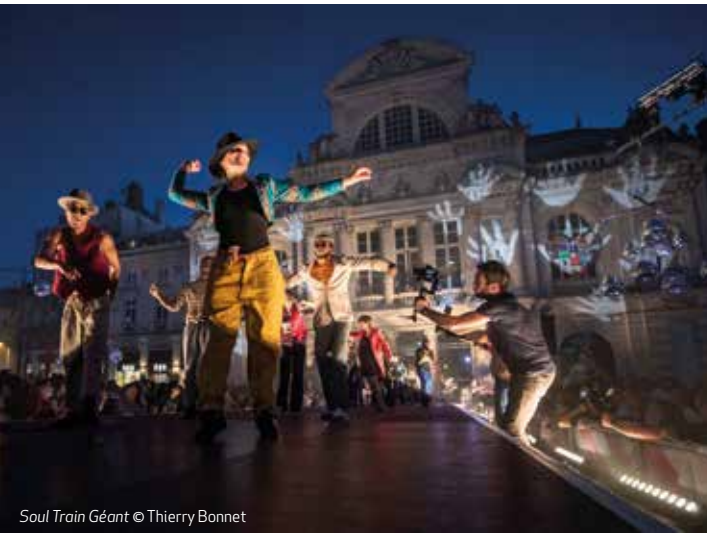
Soul Train Géant

Programme complet sur saison-culturelle.dinan-agglomeration.fr et cridelormeau.com