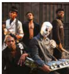
Kin'gongolo Kiniata

En provenance directe de la République Démocratique du Congo, nourri par les ambiances sonores de Kinshasa, le groupe traduit la vie frénétique de ses rues dans sa musique. Ils fabriquent eux-même leurs instruments avec des objets qu'ils recyclent et explorent les textures sonores pour produire un rock-électro-congolais imparable, qui prône l'espoir et la persévérance. + 1 re partie : Muga (21h). Sam. 18 à 23h, salle des fêtes. 13/15 €