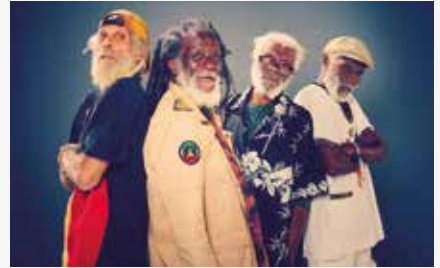
The Congos © Fra

Reggae roots. The Congos s'associent aux tout aussi mythiques Gladiators pour une tournée européenne à ne pas rater. Les légendes du reggae joueront les classiques qui ont fait leur réputation ainsi que de nouveaux titres ! Mar. 28 à 20h30. 5 à 24 €