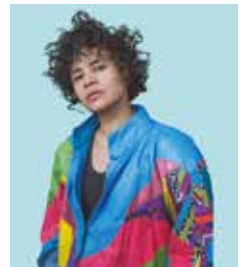
Joy Dary

Jeu de rôle grandeur nature. Org. Maison de la Baie. Dim. 2/6, horaires NC, Maison de la Terre. Gratuit. Sur résa 02 96 32 27 98