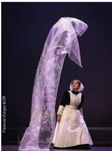
Faiseuse d'anges