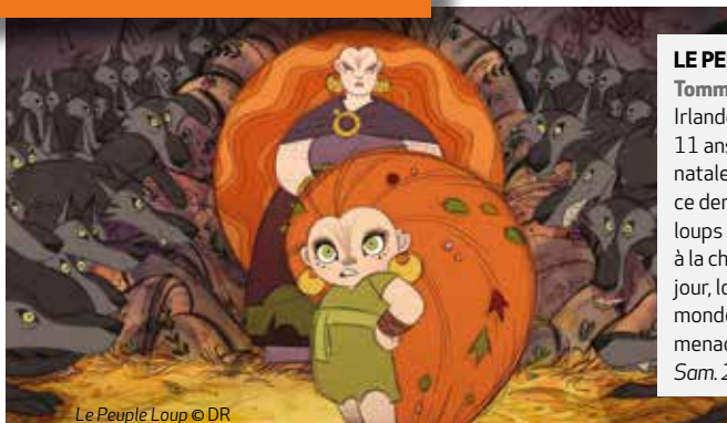
Le Peuple Loup