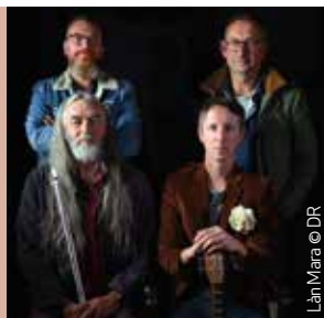
Làn Mara