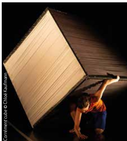
Carrément cube

Carrément cube : mer. 19 à 10h30 & 15h, Châtelaudren-Plouagat, Le Petit Écho de la Mode. 6 € ; Rouge incarnat : mar. 25 à 19h (Pléguien, salle La Salamandre), mer. 26 à 15h (Pommerit-le-Vicomte, salle socioculturelle). 3 € ; TeNir : mer. 26 à 15h & 18h (Tréméven, salle associative), ven. 28 à 19h (Goudelin, salle des fêtes), sam. 29 à 17h (Saint-Jean-Kerdaniel, salle des fêtes). 3 €