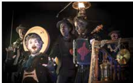
Terrès-Libres © Autre Direction