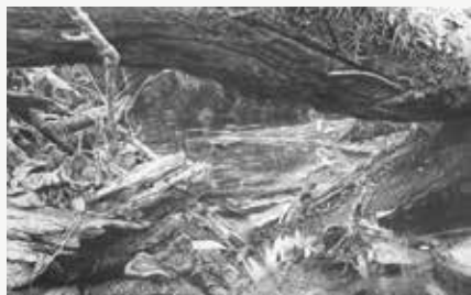
Le Littoral © Anne Le Mée