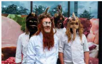
Why The Eye