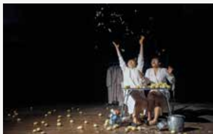
Les Filles del facteur ©Alistair Girardot

Clôture de saison. Deux propositions : Les Sales Gosses , duo de musiciens (violon-accordéon), aux voix malicieuses et sucrées (21h) et le théâtre absurde des Filles del facteur , qui raconte avec Fracas l'histoire d'amour entre deux amies foldingues. Ven. 23 dès 20h30, plaine du Verger. Gratuit