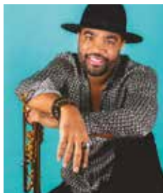
Ludovic Louis © DR