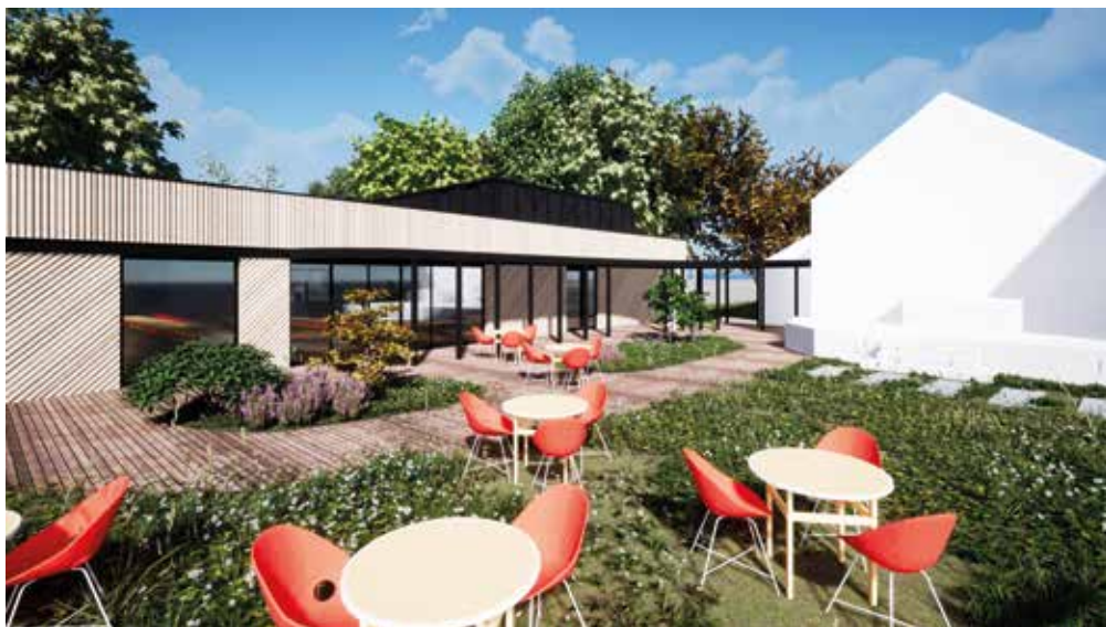
Vue 3D depuis la façade sud © Quinze Architecture

Dès le départ, ils l'ont souhaitée ouverte à tout le monde, sans limite d'âge, sans connaissances minimum du milieu, avec pour seule qualification requise le niveau bac. Pour s'inscrire, Ty Films a demandé aux candidats de réaliser un dossier artistique, ayant pour thème « À