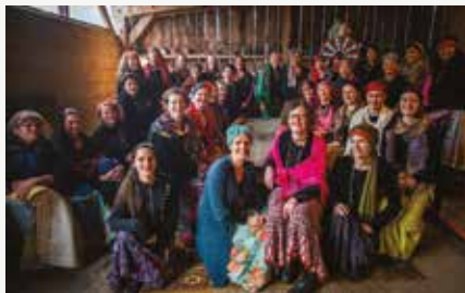
Moniquihard © DR

Chants du monde. Chorale du collège Vasarely (19h), chorale éphémère du Mené en 5 langues (19h30), batucada par l'école de musique (20h), Les Amis de Garibou-ton: musique et danses du Mali (20h30), Fête au village avec danse & musique des Balkans (21h). Ven. 16 à 19h. Gratuit