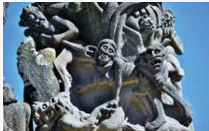
Calvaire de Guimiliau, détail Katell © DR