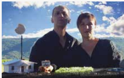
Tire-toi de mon herbe Bambi

Festival Les Marionnet'lc. Une soirée, quatre spectacles ! Au programme : Alors ça mord ? par la Cie Niclounivis, L'amour du risque par la Cie Bakélite, Hybrides par la Cie juste après et Tire-toi de mon herbe Bambi par la Cie La cour singulière. Ven. 16 à 19h. 12 €. Dès 8 ans