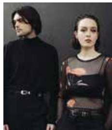
Fallen Alien