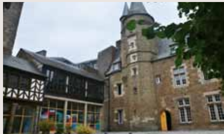
Hôtel du Département