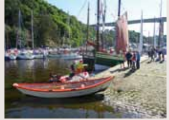
Port du Légué

Org. Villes, en partenariat avec le réseau associatif. Sam. 15., dim. 16/9. Gratuit. Programme complet : Plérin 02 96 79 82 27 - www.ville-plerin.fr / St-Brieuc 02 96 62 54 94 - www.saint-brieuc.fr