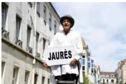
CIA © M. Wiert