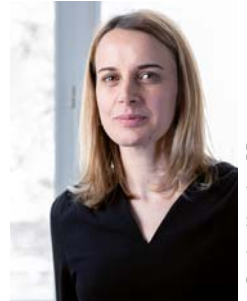
Caroline Hinault © DR

En Eaux troubles , des 4 e de La Trinité Porhoet guidés par J-M Flageul. Pleumeur Vaudou , détournement de sculptures de meubles bretons par Bruno Pansart.