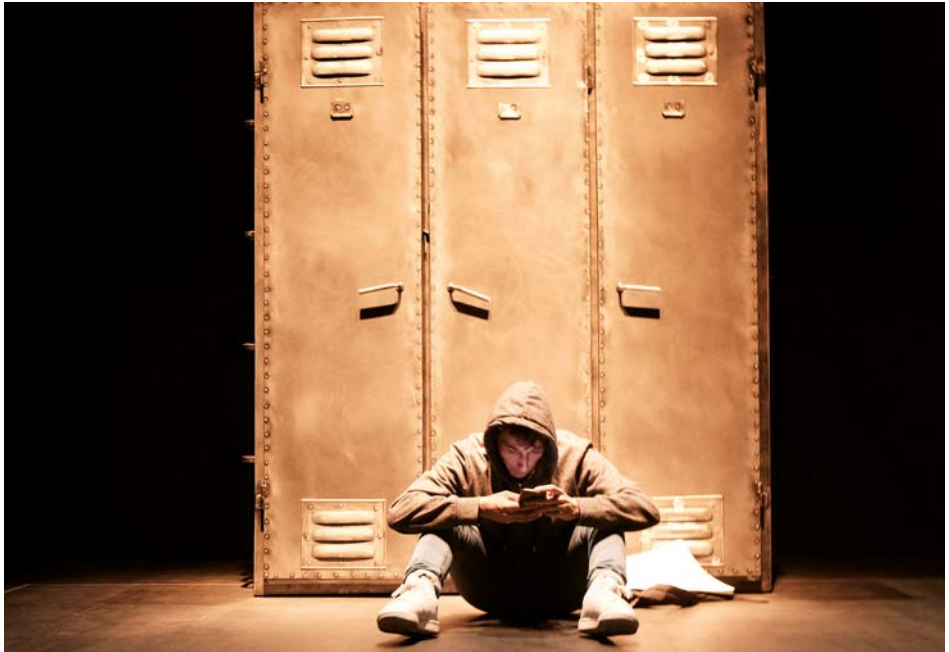
Tomber en amour