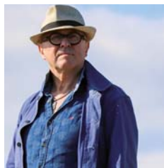
Yann-Fañch Kemener