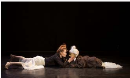
Nonna(s)don'tcry © DR

10 e édition. Festival autour de la danse. 18h : les pratiques amateurs. 20h : Mohini Attam - Brigitte Chataignier Poèmes dansés du Kerala, danse du sud-ouest de l'Inde + atelier danse de l'Inde du Sud, initiation, découverte du Mohini Attam (ven. 26 à 19h, Clef des Arts, 5 €, dès 12 ans). Home Sweet Home - Franck Guiblin Solo de danse en création, dystopie nous invitant à faire un voyage dans un huis clos surréaliste. Boucle - Cie Xuan Le Solo sur rollers. Pode Ser - Leïla Ka Danse contemporaine, hip hop en solo. Nonna(s) don't cry - Dirtz Théâtre Danse et marionnette portée autour de la transmission. + Atelier : la manipulation d'objet, accessoire ou partenaire ? (sam. 27 à 10h, Clef des Arts, 5 €, dès 12 ans). Terre - Cie Didier Théron Trois femmes s'emparent de l'énergie musicale aux accords d'ACDC pour s'y déployer pleinement, en rondeurs hors normes, artificielles et somptueuses. Sam. 27 dès 18h. 18 à 6 €