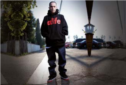
The Alchemist