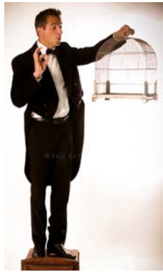
Le Siffleur

d'autodérision ce virtuose de la glotte casse les codes de la musique classique. D'humour il fait preuve, autant que de sérieux car siffler n'est pas chose aisée. Avec flegme et élégance, il est maître du sifflet, maître-conférencier burlesque et maître de l'humour décalé. Ce maestro taquine nos oreilles et fait mouche à chaque fois. Dim. 21 à 14h30