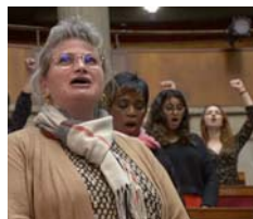
Debout les femmes !

Guillemet (VOSTF). Lun. 29 à 20h30 : Debout les femmes! , François Ruffin et Gilles Perret (présent). Du 2 au 29/11. 4, 5 €