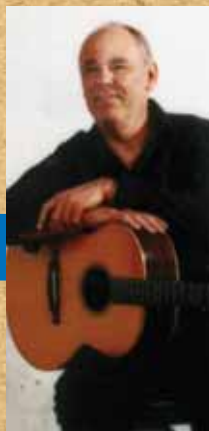
Maxime Le Forestier • 24/11/05