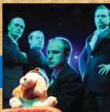
Ministère de la jeunesse & de la magouille • 26/10/05