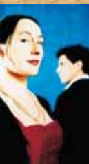
Nid de Coucou • 27/01/06