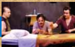
Cie Caravane • 10/02/06