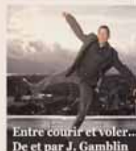
Entre courir et voler... De et par J. Gamblin