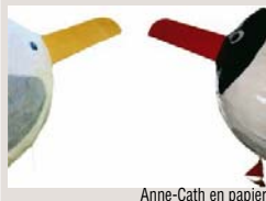
Anne-Cath en papier

26 place du Martray. Lun. au sam. 10h-12h30, 14h-18h30. Dim. 10h-12h30