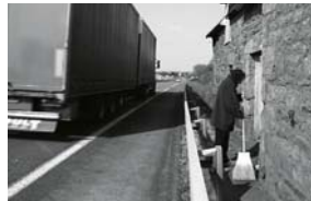
Extrait © Gil Bouedec

Du 12 au 22/12. Carré Rosengart Tjij 15h-18h, we 10h-12h, 15h-18h Gratuit