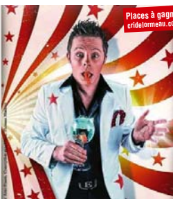
Places à gagner cridelormeau.com

Rock alternatif mêlant ombre, rage, outrance, électricité et sonorités puissantes et nuancées. Sam. 27 à 21h30. Gratuit