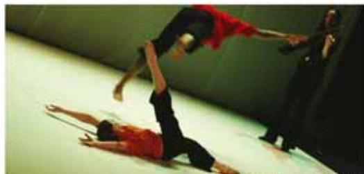
Jeux de Hasard © Yannick Derennes

Renseignements : laurence.merckelbagh@addm22.com