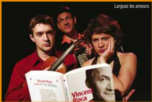
Larguez les amours

Mar. 28 à 21h. TP 12 € / TR 10€ / Enf 8 €