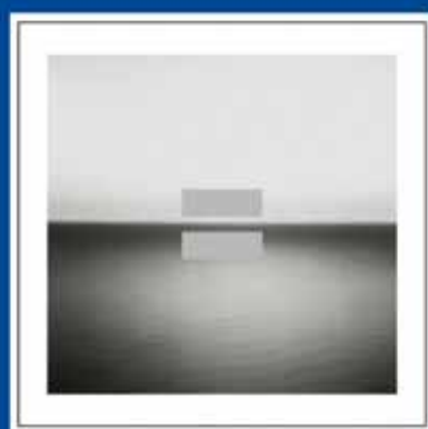
U2 No Line on the horizon CD - 15,99€

ZAC du Plateau - Centre commercial Leclerc de Plérin Tél. 02 96 79 86 06 - Ouvert du lundi au samedi de 9h à 20h