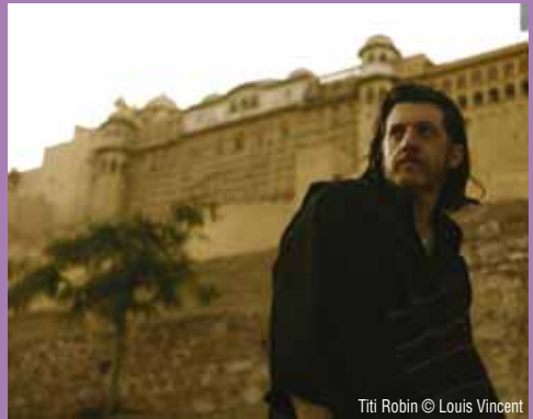
Titi Robin © Louis Vincent

Ven. 6 à 20h30. Tarif 18 € / 16 € / 13 € / 5,5 €