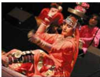
LANGUEUX LE GRAND PRÉ

Jusqu'au 29. Galeries permanentes. Mer au sam 10h-12h et 13h30-18h, dim et jours fériés 14h-18h, mar sur rdv