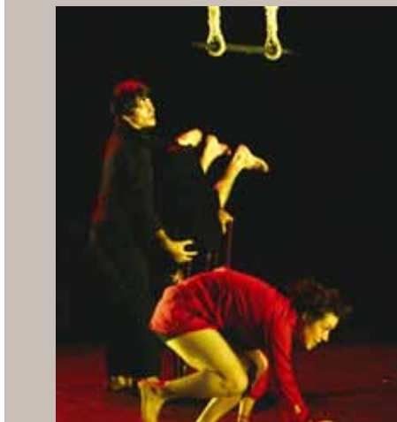
Le Parti des choses