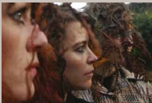
Teach us to outgrow our madness

Priz'unique #19. Concert avec Chapelier Fou, Kevin Belchdrom, Panico + spectacle de Teach us to outgrow our madness (nouvelle création de la chorégraphe islandaise Erna Omarsdottir - coproduction de La Passerelle). 21h