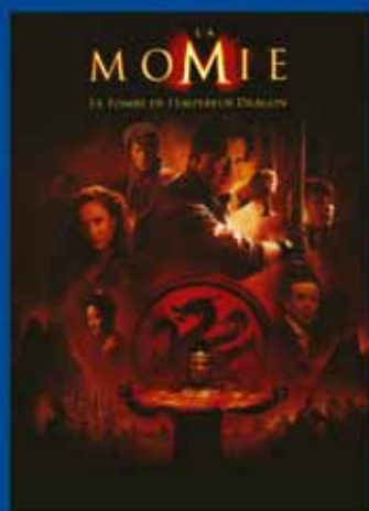
La Momie DVD - 19,99€