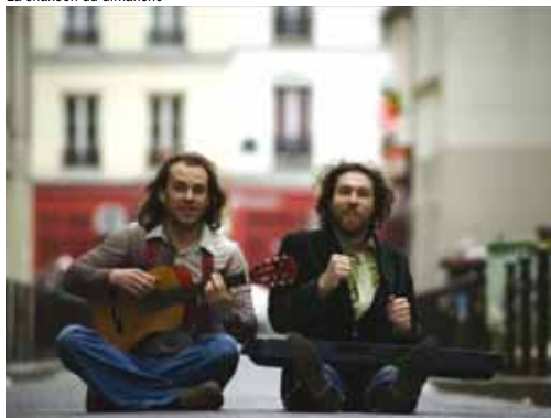
La chanson du dimanche

suivi d'Elisa Do Brasil (Drum & Bass-Jungle-Break beat). Le vainqueur jouera en 1 ère partie de la 14 e édition du festival Roc'han Feu le 27 juin. Sam. 28 à 20h30. Salle de la Belle Etoile. Tarif : 8€ sur place Happy Hour de 21h à 22h et 1 T-shirt RHF offert. Org. Association Roc'han Feu. 02 97 51 50 63 www.rochanfeu.com