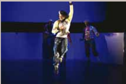
Roméos et Juliette © Dan Aucant

Mar. 17 à 20h30. Tarifs 18 € / 16 € / 14 €