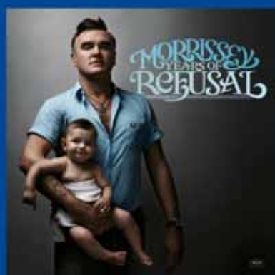
Morrissey Years of refusal CD - 14,99€