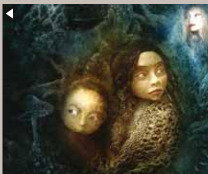
Hansel et Grethel

Ven. 27 à 20h30. Tarifs 18 € / 15 € / 14 €