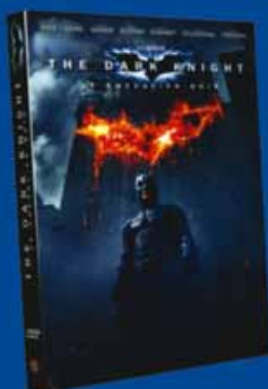
The Dark Knight DVD - 19,99€