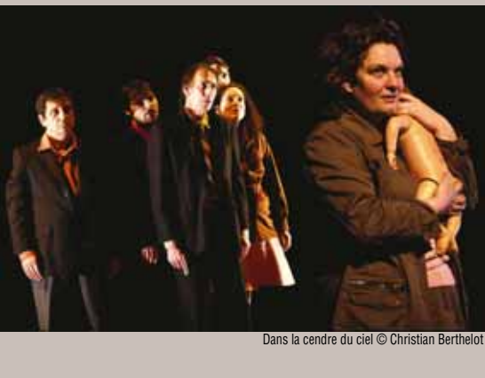
Dans la cendre du ciel