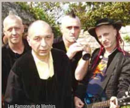
Les Ramoneurs de Menhirs

+ Après le concert : les élèves et tous les musiciens amateur de jazz qui le souhaitent animeront un boeuf.