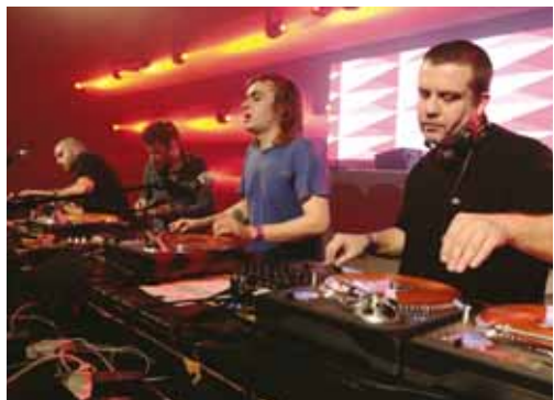
Birdy Nam Nam

Sexy Sushi, Belleruche, Karkwa, Curry & Coco, Switch on's. 19h-4h. Prix 10/12/15€