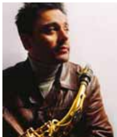
Pierrick Pedron © DR

Conférence dansée. Wayne Barbaste. Mer. 25 à 18h30. Quai des Rêves