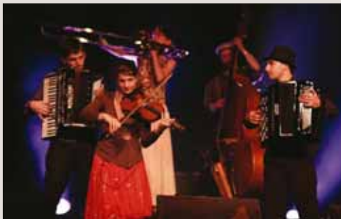
Lentement Mademoiselle

A travers leur jeu clownesque, farceurs, danseurs et musiciens vous feront découvrir