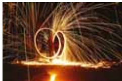
Cirque en Spray

Dim. 27 dès 10h. Théâtre de verdure. Gratuit