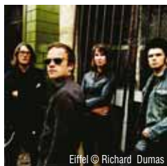
Eiffel © Richard Dumas