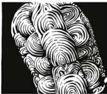
Sur la flaque ou sur la pierre... Kan ha diskan !