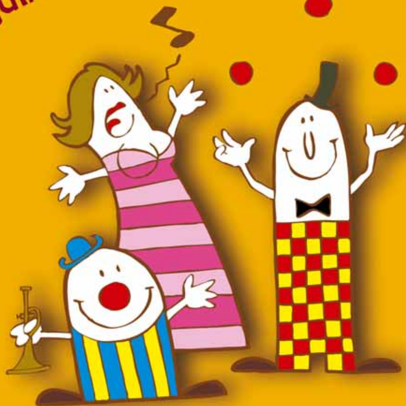
Illustration : © Pajoto 2010 - Reproduction interdite

SPECTACLES DE RUE - CONCERTS VÉHICULES ANCIENS