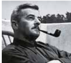
W. Faulkner

Sam. 2 à 15h. Librairie La Cédille Gratuit. 02 96 30 98 51