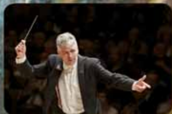
Direction LLEWELLYN Grant