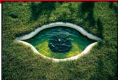
Jardin © Pascal Cribier

Du 24/6 au 26/8. Lanrivain, St-Antoine et Grand Launay. Ploërdut, Locuon (56). Lignol, château du Coscro (56). Tarifs 5 €/jour, gratuit <12 ans. Pass saison 30 € lieux-mouvants.com