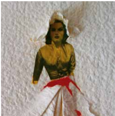
Collage - Femme des années 60

L'Atelier du Papetier - Pôle Phoenix 22560 Pleumeur-Bodou 06 31 00 26 85 - contact@latelierdupapetier.fr - latelierdupapetier.fr