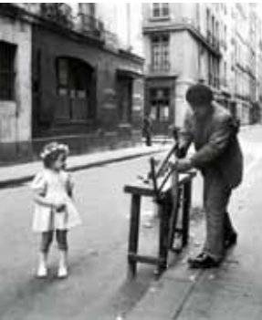
Atelier Robert Doisneau - Le menuisier de la rue St-Louis en l'Isle, Paris 1947

Du 16/6 au 30/9. Villa Les Roches Brunès. Tarifs 6/4 €, gratuit <7 ans. 16/6-30/9 mar-dim. 14h-19h hors vac scolaires (16/6 au 6/7, puis 3 au 30/9). 11h-19h pdt vac scolaires (7/7 au 2/9)