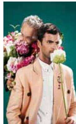
Polo & Pan

comme seul mot d'ordre Vivre et Agir Ensemble. Jean Rêve encore, par la troupe de théâtre Rire et Faire Rire, porté par le groupe vocal Maniafoly et ses 18 chanteurs.