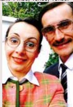
Théâtre du Totem