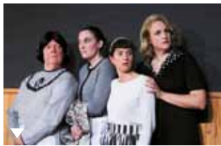
8 Femmes

Société Protectrice de Petites Idées. Danse /Nouveau cirque. Un ballet exigeant de virtuosités physiques et théâtrales, d'indélicatesse, de romance des années 90. Sam. 2 à 17h. Prairie Traouzac'h